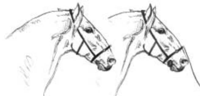
Abb.: 43: Zäumung auf Kappzaum oder Kappzaum mit Gebiß

Die folgenden Ausführungen werden auf alle diese Fragen eine Antwort geben und im Anschluß daran die Hilfen für einige ausgewählte Lektionen aufzeigen. Da die meisten nun auf dem Ausbildungsplan stehenden Lektionen sehr komplex sind, werden die exakten Hilfen und das konzeptionelle Vorgehen im Kapitel „Konkrete Beispiele“ ab Seite 141 ff detailliert erklärt – so kann man den Roten Faden aufgreifen, der sich gerade bei Lektionen wie dem Travers oder der Piaffe vom ersten Parallelführen durch das Longieren, die Doppellongenarbeit, die Ausbildung am langen Zügel bis zur Handarbeit und später zum Reiten zieht.