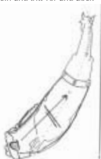
Abbildungen 64 a-d: zum Biß, zur Gerte und zur Wade hintreten